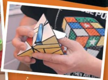
● 小朋友挑戰三角形扭計殼。