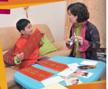
父母可利用 配對遊戲跟子女 練習拜年的 情況。

「恭喜發財！」還有一星期才到農曆年，現在拜年早了一點？不早呢！新春拜年活動頻頻，要提防小朋友在親友面前失禮，父母事前要做足準備，讓子女做個「有禮醒目」的乖孩子，多掙利是過肥年！家長還可趁機教孩子正確理財之道，用利是錢購買「利是股」，實行新年大豐收。