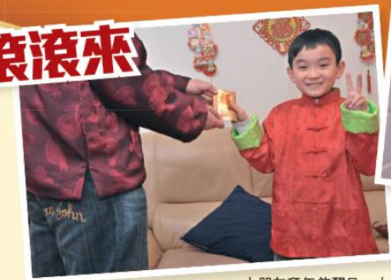
● 小朋友拜年夠醒目，大人派利是亦特別順手。