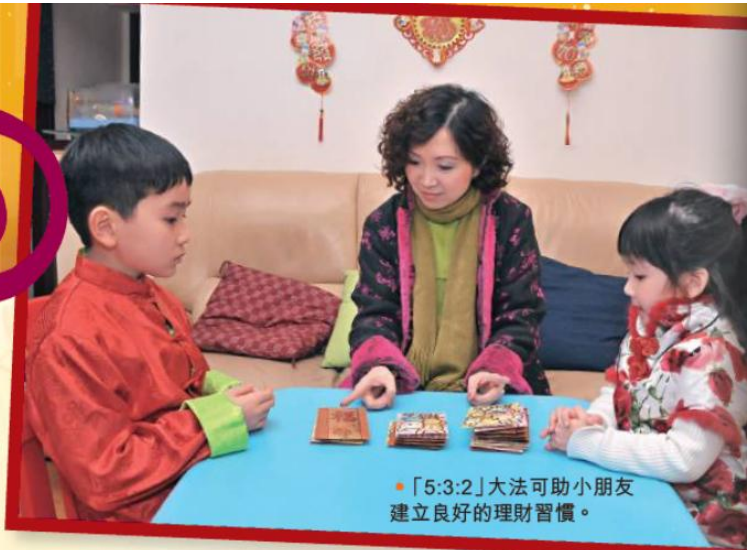
•「5:3:2」大法可助小朋友建立良好的理財習慣。

如何分配利是錢？關顯彬建議五成用作儲蓄、三成用作消費，其餘兩成用作分享，細節則由家長與子女共同協議。關顯彬認為，合夥管理利是錢有四個原則，「簡單而言，是為己、為人、為現在、為未來。」