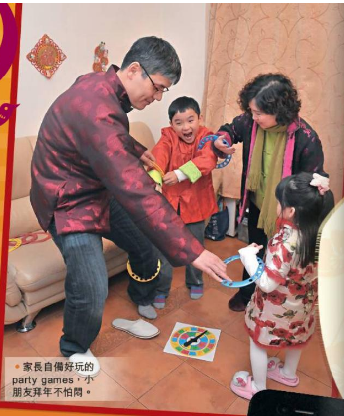
● 家長自備好玩的 party games，小朋友拜年不怕悶。

若同場沒其他孩子，小朋友亦不乏自娛玩意。簡單如「扭計殼」，可考驗孩子的觀察力、分析力和記憶力；要新鮮感可選三角形和圓形款式。電子潮物iPad亦可充當「玩伴」，家長預先下載適合小朋友的apps，推介「找不同」遊戲「What's the Difference」(US$3.99)，以及近期大熱的「Smurfs' Village」(免費)，小朋友要為「藍精靈」建立村莊，並負責分配工作及處理財務，還可學到不同蔬果的英文名稱。